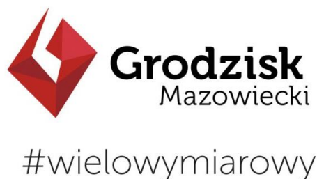
Rys. 2. Herb oraz logo Grodziska Mazowieckiego